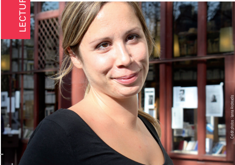
Cédric photos - Ianna Andreazis