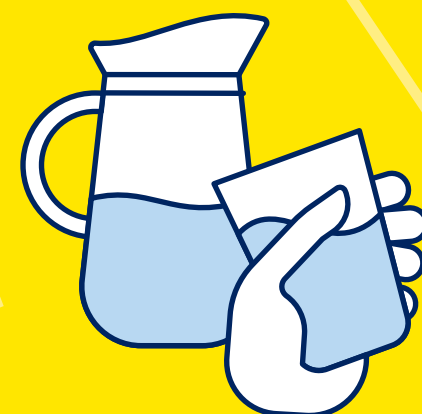
BUVEZ DE L'EAU